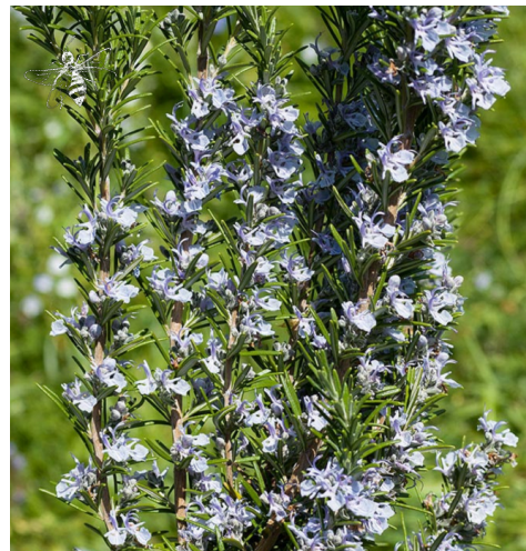
ROSMARIN ( Salvia rosmarinus )

Merkmale: rosa, lila,violett 0.30 -0.60m, mehrjährig Blühzeit: Juli - September Standort: sonnig, halbschattig