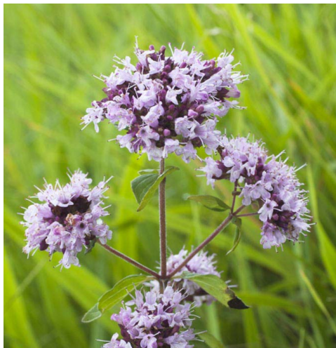
OREGANO, GEWÖHNLICHER DOST ( Origanum vulgare )

Merkmale: rosa,lila,violett, 0.10-0.30m, mehrjährig Blühzeit: Juni - Juli Standort: sonnig, halbschattig