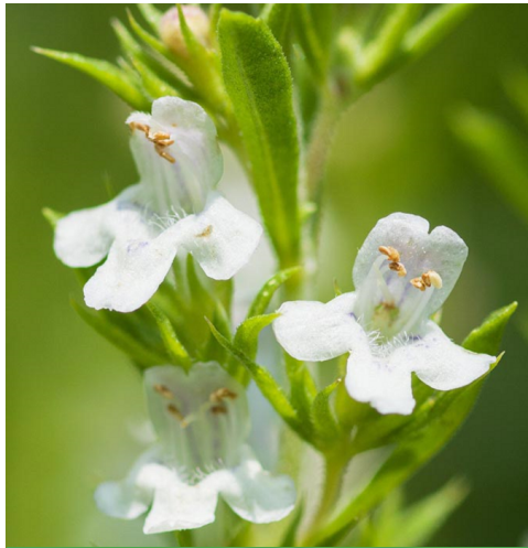
WINTER-BOHNENKRAUT ( Satureja montana )

Merkmale: gelb, 0.50 -1.00m, saisonal Blühzeit: Juli - September Standort: sonnig