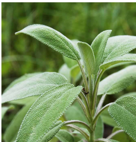
SALBEI, ECHTER SALBEI ( Salvia officinalis )

Merkmale: blau, 1.0-1.45m, mehrjährig Blühzeit: Juli - August Standort: sonnig