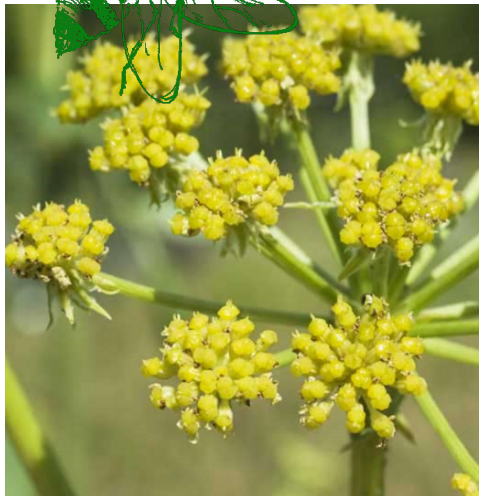
LIEBSTÖCKEL, MAGGIKRAUT ( Levisticum officinale )

Merkmale: gelb, 1.20 -1.50m, mehrjährig Blühzeit: Juli - August Standort: sonnig, halbschattig