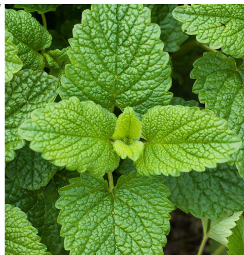
ZITRONEN-MELISSE ( Melissa officinalis )

Merkmale: gelb, 0.20 -0.90m, mehrjährig Blühzeit: Juni - Juli Standort: sonnig