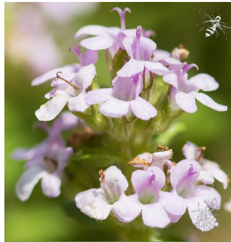
THYMIAN ( Thymus vulgaris )

Merkmale: weiss, 0.20 -0.50m, saisonal Blühzeit: Juli - August Standort: sonnig