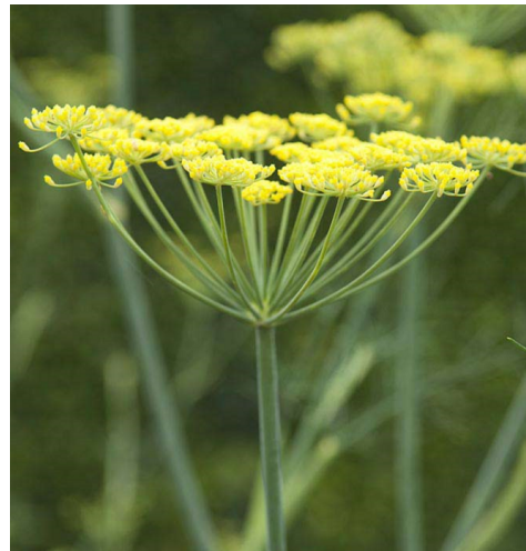
FENCHEL ( Foeniculum vulgare )

Merkmale: gelb, 0.20 - 0.50m, mehrjährig Blühzeit: Juni - Juli Standort: sonnig