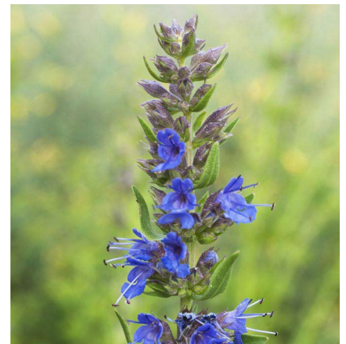
YSOP ( Hyssopus officinalis )

Merkmale: blau, 0.70 -1.00m, mehrjährig Blühzeit: April - Juni Standort: sonnig