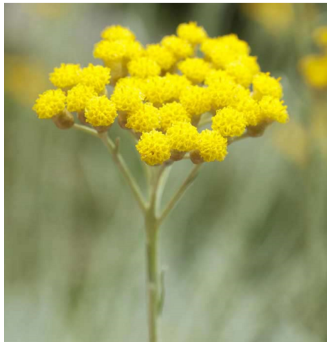
CURRYKRAUT ( Helichrysum italicum )

Merkmale: gelb, 1.20 -1.50m, mehrjährig Blühzeit: Juli - August Standort: sonnig, halbschattig