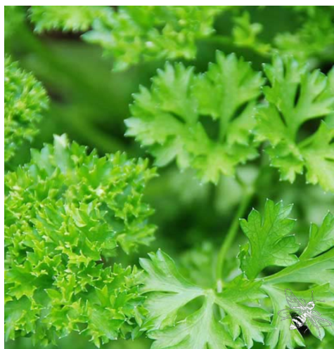
PETERSILIE ( Petroselinum crispum )

Merkmale: blau, 0.40 - 0.60m, mehrjährig Blühzeit: Juni - August Standort: sonnig