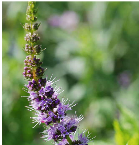
PFEFFER-MINZE ( Mentha x piperita )

Merkmale: rosa,lila,violett 0.20 -0.30m, mehrjährig Blühzeit: Juni - September Standort: sonnig