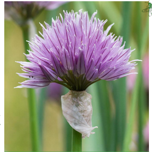
SCHNITTLAUCH ( Allium schoenoprasum )

Merkmale: rosa,lila,violett, 0.20 - 0.30m, mehrjährig Blühzeit: Juni -Oktober Standort: sonnig