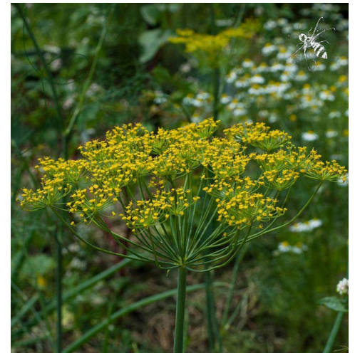
DILL, ACKER-DILL ( Anethum graveolens )

Merkmale: gelb, 1.30 - 1.80m, mehrjährig Blühzeit: Juli - Oktober Standort: sonnig