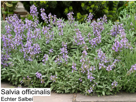
Salvia officinalis Echter Salbei