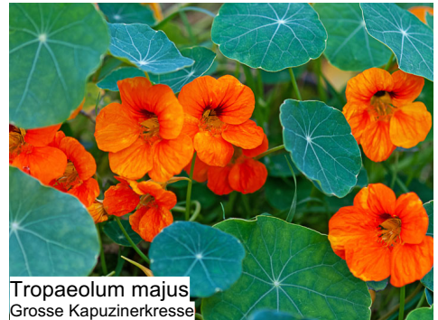
Tropaeolum majus Grosse Kapuzinerkresse