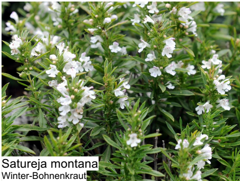
Satureja montana Winter-Bohnenkraut