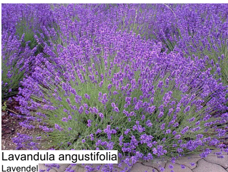
Lavandula angustifolia Lavendel