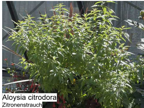
Aloysia citrodora Zitronenstrauch