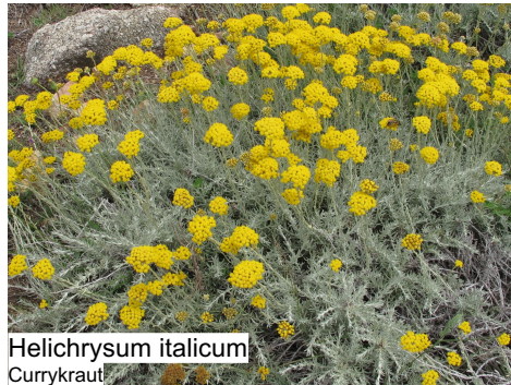
Helichrysum italicum Currykraut