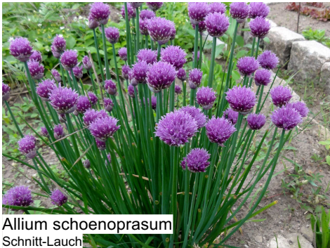
Allium schoenoprasum Schnitt-Lauch