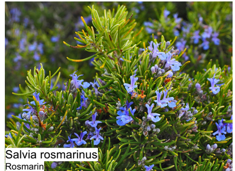
Salvia rosmarinus Rosmarin