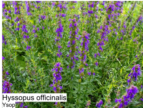
Hyssopus officinalis Ysop