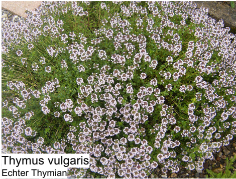
Thymus vulgaris Echter Thymian