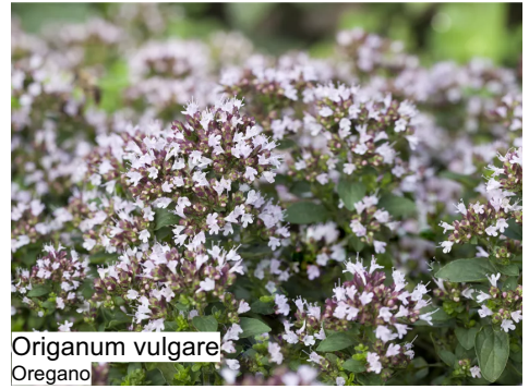
Origanum vulgare Oregano